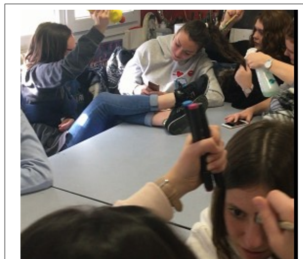
Réalisation de mannequin challenge avec les tablettes et téléphones portables